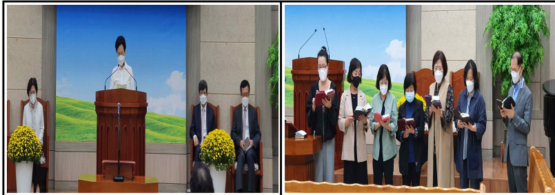
가을 말씀축제 / 10일(주일)