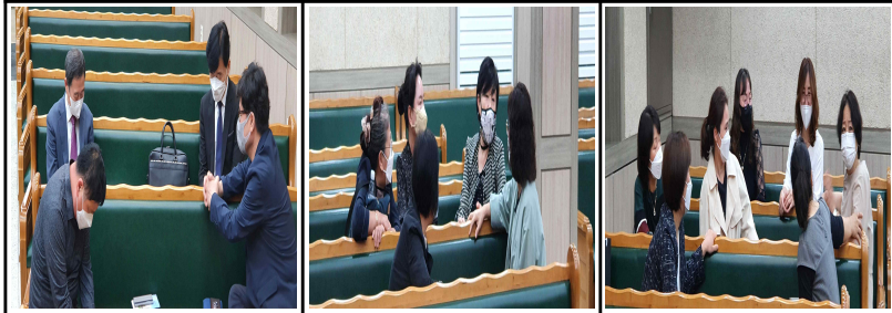
기관 월례회 / 10일(주일)