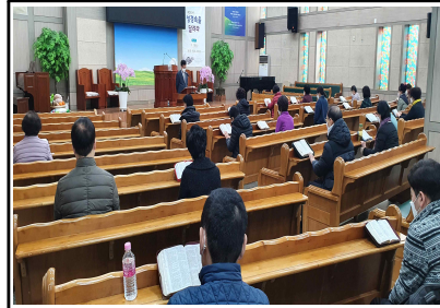
20차 성경 속을 달려라 / 13일(토)