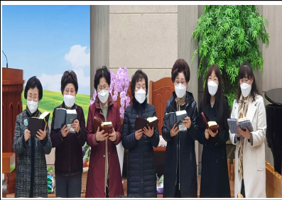
13,14구역 수요일예 특송 / 17일(수)