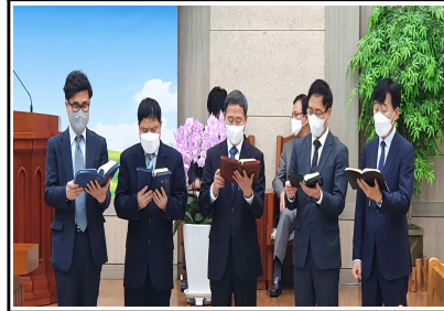
가을 말씀축제 / 14일(주일)