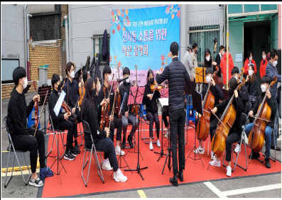
주민자치회 작은 음악회 / 13일(토)