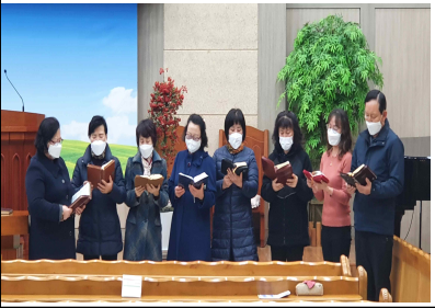
15,16,17구역 수요예배 특송 / 24일(수)