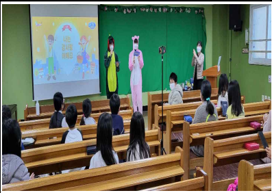
예배(감사TV) / 14일(주일)