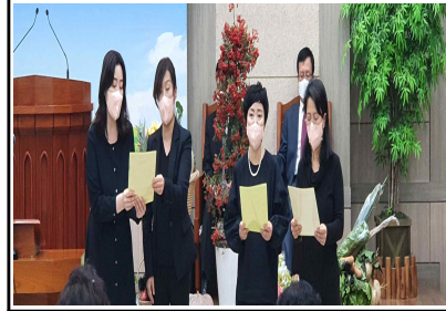
가을 말씀축제 / 21일(주일)