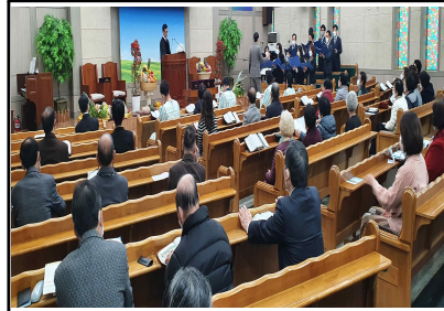
예배 / 21일(주일)