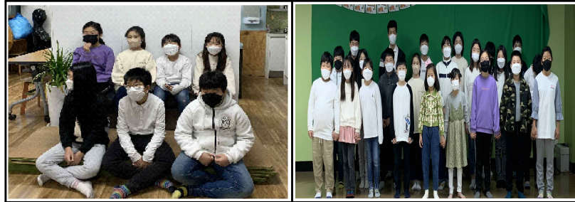
교회학교 연합회 온라인 경창대회 / 11월 28일(주일)