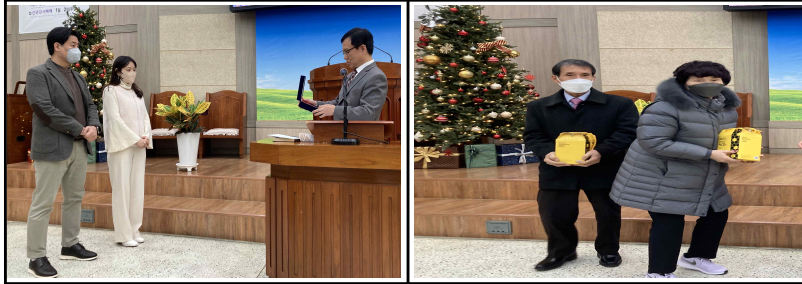
올해의 은천인 시상 / 19일(주일)