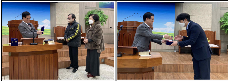
40 근속 시상 / 19일(주일)